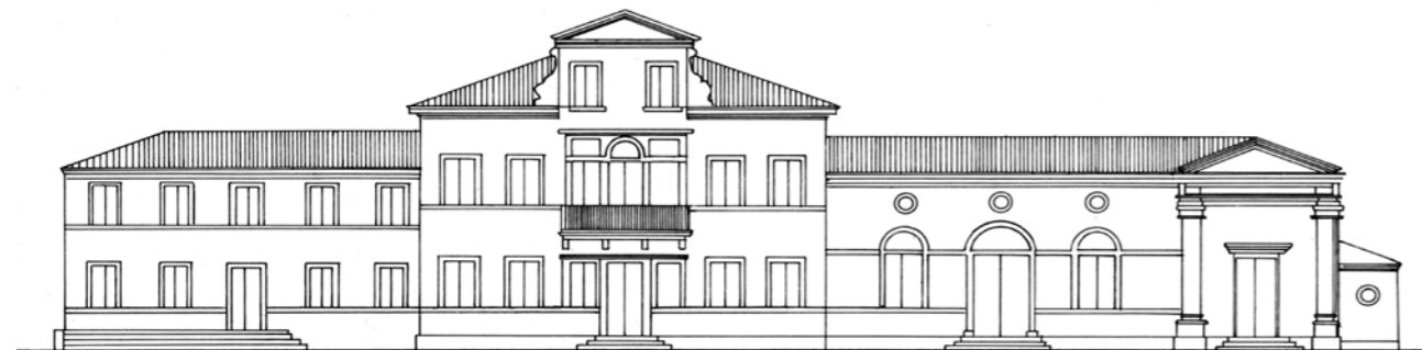
Disegno ricostruttivo dell'aspetto della villa dopo gli interventi effettuati nel Settecento.

Ai primi dell'Ottocento la situazione doveva essere un po' cambiata: dal Catasto Napoleonico abbiamo la pianta della villa, di una cappella e di un altro edificio sul davanti ad oriente (un "barco" o una costruzione agricola).