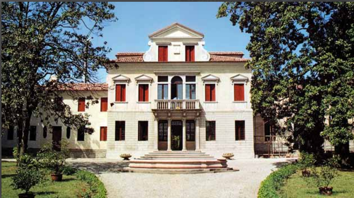
VILLA MEMO GIORDANI VALERI