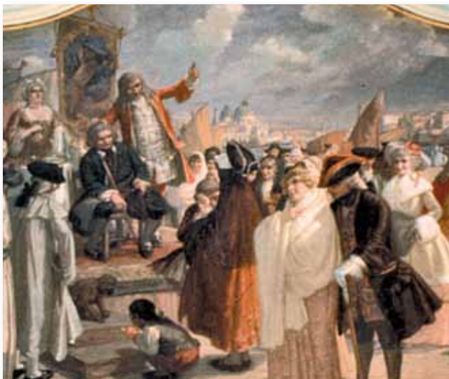
Il cavadenti: scena spiritosa immaginata in Piazza San Marco a Venezia

In un ambiente dell'ala destra orientale, un tempo quasi completamente destinata a “sala da musica” ci sono alcuni preziosi stucchi dipinti con figure allegoriche. Sulla parete laterale sinistra appare “Il cavadenti” opera famosa di Vittorio Emanuele Bressanin.