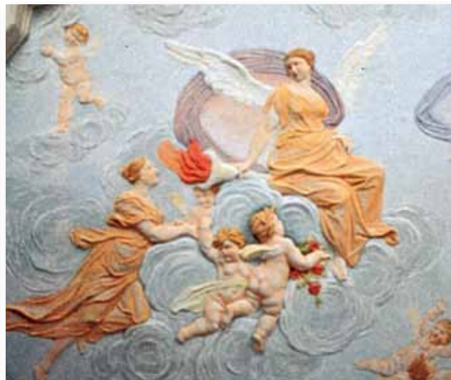
Figura allegorica: La Fede?

Le informazioni storiche, i disegni e le foto riportate in questo opuscolo sono tratte dal libro “Una Comunità sul fiume” (1992) del nostro concittadino prof. Vittorio Galliazzo, al quale va il ringraziamento dell’Amministrazione per aver gentilmente concesso l’autorizzazione alla loro pubblicazione.