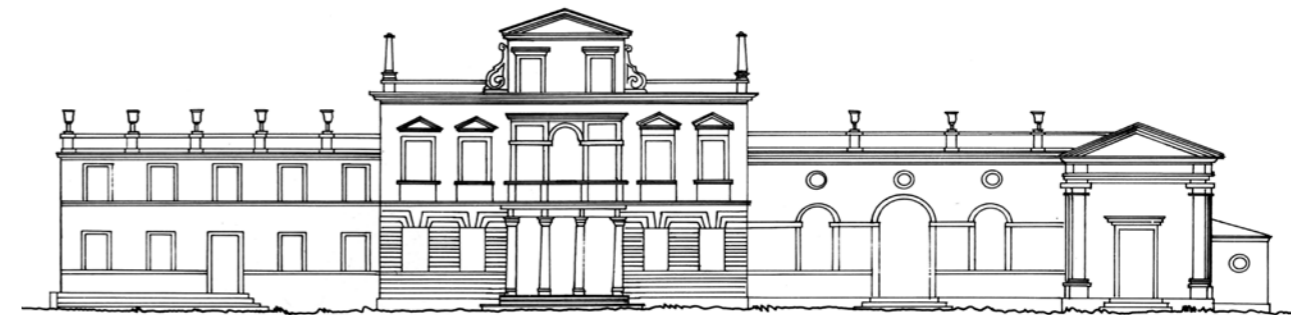
Disegno ricostruttivo del prospetto della villa dopo il restauro artistico.

L'attuale situazione della villa deriva dai due ultimi restauri avvenuti in anni recenti: quello attorno al 1970 realizzato dalla famiglia Valeri e quello successivo messo in opera dalla famiglia Cenedese.